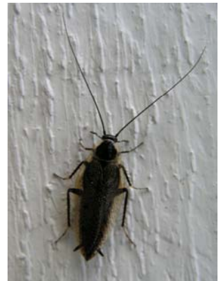
Skal denne bekjempes? Nei, det er en markkakerlakk.

Når dyret er kjent, må du vurdere om det skal bekjempes, og om du eventuelt skal utføre bekjempelsen selv. Er problemet for stort, vanskelig eller du av andre årsaker ikke selv ønsker å gjennomføre skadedyrbekjempelsen, kan du få et skadedyrfirma til å hjelpe deg (Les mer i: "Veileder om kjøp av skadedyrbekjempelse").