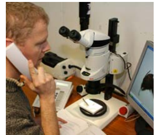
Avdeling for skadedyrkontroll identifiserer og svarer på spørsmål om skadedyr